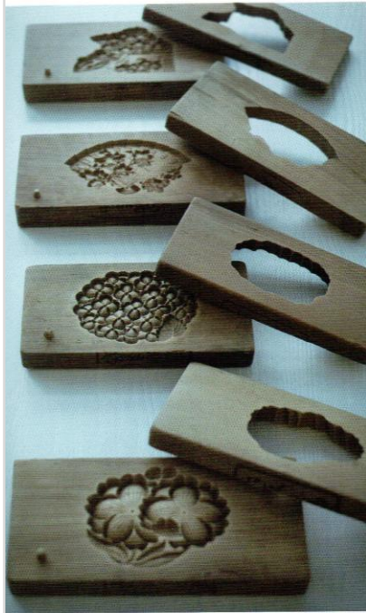
写真、左から時計回りに：和菓子を成形する木型。50年以上使われているものもある。／生菓子「新千歳の縁」。1,000年変わらぬ松のめでたさを表現する。／初夏の生菓子「夏茄子」。1711年からつくられている。／年代物の産の置物。会社のエンタランスに飾られている。／隣頭に模様を入れる焼き印。さまざまなパターンが用意されている。